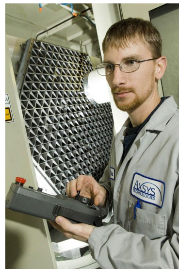
Fot. 2. Operatorzy maszyn CNC mogą pracować np. przy wymagającej wielkiej precyzji produkcji komponentów do teleskopów, w tym przypadku Teleskopu Jamesa Webba

Robotyki w Mielcu najprawdopodobniej nie byłoby, gdyby nie liczne przedsięwzięcia popularyzatorskie grupy pasjonatów i wydarzenia takie jak Mielecki Festiwal Nauki i Techniki (pierwsza edycja w 2011 r.), Dzięki tym działaniom w 2015 r. powstała Młodzieżowa Akademia Umiejętności Technicznych „Leonardo”. Prowadzone są w niej zajęcia takie jak np. „Laboratorium Modelarstwa i Rakiet Kosmicznych” czy „Laboratorium budowy i programowania robotów” (w grupach o różnych poziomach zaawansowania). Uczestnicy i absolwenci Akademii od lat zdobywają nagrody na krajowych i międzynarodowych zawodach i konkursach.