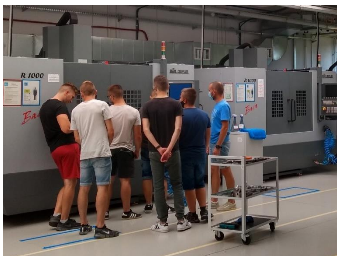
Fot. 1. Jeden z warsztatów w Centrum Kształcenia Praktycznego w Rzeszowie

Szansę na zwiększenie efektywności systemu kształcenia zawodowego w dostarczaniu kadr niezbędnych dla modernizującej się gospodarki pojawiły się wraz przystąpieniem do Unii Europejskiej. W całej Polsce, dzięki uruchamianym na przestrzeni ostatnich kilkunastu lat projektom, zaczęto wzmacniać potencjał szkół, rozumiany zarówno jako infrastruktura, jak i zasoby ludzkie. Remontowano pomieszczenia, inwestowano w wyposażenie a także dofinansowano szkolenie kadry, albo poradnictwo zawodowe. Projekty realizowane były przez samorządy powiatowe i gminne, często z udziałem partnerów gospodarczych, ale wspólne ramowe założenia i priorytety uzgadniano na poziomie urzędów marszałkowskich. W województwie podkarpackim priorytetowo zaopiekowano się placówkami i kierunkami perspektywicznymi z punktu widzenia specyfiki, po części też tradycji regionu. Na miejscu funkcjonują bowiem przedsiębiorstwa przemysłowe, spośród których wybijają się te należące do branży lotniczej powiązanej z sektorem kosmicznym.